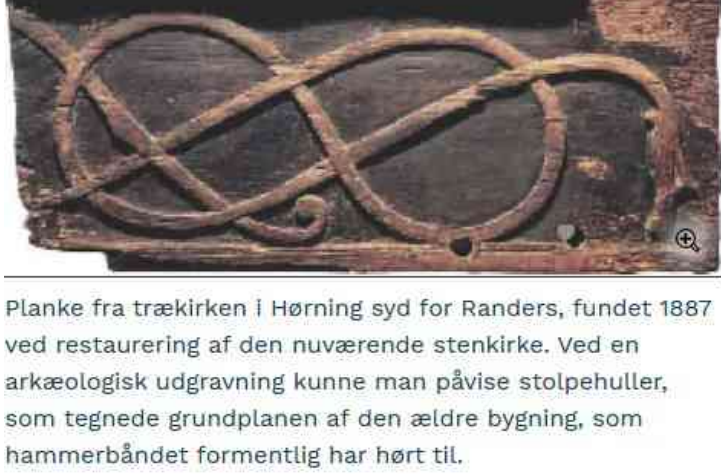
Planke fra trækirken i Hørning syd for Randers, fundet 1887 ved restaurering af den nuværende stenkirke. Ved en arkæologisk udgravning kunne man påvise stolpehuller, som tegnede grundplanen af den ældre bygning, som hammerbåndet formentlig har hørt til.

Ydby Hede og Bodum Høje udgør en kalender forbundet af broen over Dover Kiel nu Bro-kjær, med tre natur skabte retninger, og den manglende fjerde fyldt at Tvolm Høje ved Ydby Kirke. Man kan tale om at kalenderen har de grundlæggende elementer af vikinge ormen-elektirske ål-ormen, snoet i et ottetal set oppe fra. Ottetallet er pindet til jorden som hvis det var hårpunt, med en tværpind som udgør equinox akse, hvor kæreren i henholdvis sæd og høst kører lige øst vest til transport-havn eller lager, medens soltice akserne er jo nord-vest-sydøst og den modsatte. Denne Lys-Mørke modsat forbindelse, er jo ældre end vore historiske tid som jo ses af Gundestrup-karret som er fundet få kilometer væk – hvor netop osptandelsen ses i Carnyx optoget. Princippet i den elektriske ål-dragen-ormen eller hvad ses herunder fra Natmus: