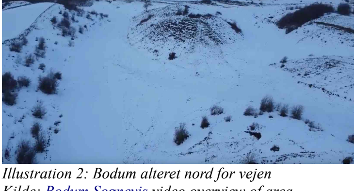
Illustration 2: Bodum alteret nord for vejen

Langhøjen på Heden og to andre langhøje længere inde i landet deres retninger ser ud til at være bestemt af occupantens oprindelses føde sted. Der er givetvis mange flere langhøje end disse tre meget prominente.