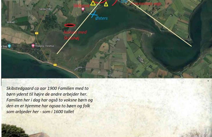
Skibstedgaard ca aar 1900 Familien med to børn yderst til højre de andre arbejder her. Familien her i dag har også to voksne børn og den en er hjemme har ogsaa to børn og folk som arbejder her - som i 1600 tallet

Herunder localicerer de vigtigste elementer i kalender(ne). Givetvis har dette været brugt siden mennesket vel kom her 12,000år siden. Man kan vel forestille sig at da havet lå lavere end i dag, at der stadig var en frodig Limfjords Højlands, sø ligesom vestyer Vandet i dag ligger 18m over havet, eller Bøllingsø som ligger vel i 80meters højde, med udfald i begge ender, den en vender faktisk heropimod Limfjorden og kan have været farbar i et mere vådt og u-drænet klima.